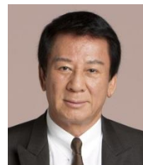
厚生労働省 肝炎総合対策推進 国民運動 特別参与 杉 良太郎